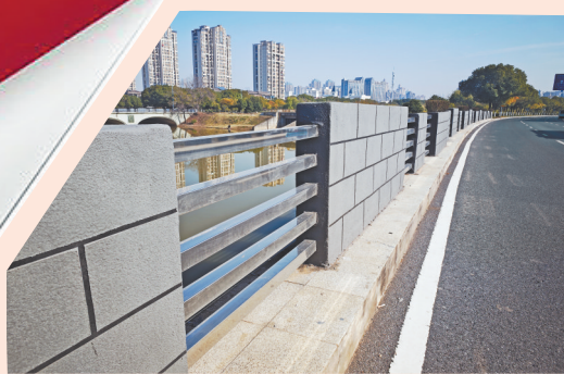
红谷滩区学府大道上的桥梁新护栏。