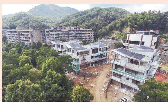
曾经被毁的山林已复绿。