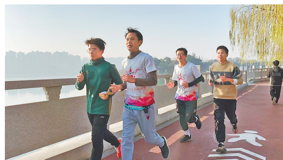
红五星助跑团带领视障者跑步。