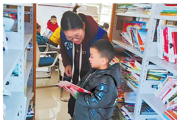
在新建区石埠镇图书室，志愿者帮留守儿童选书。