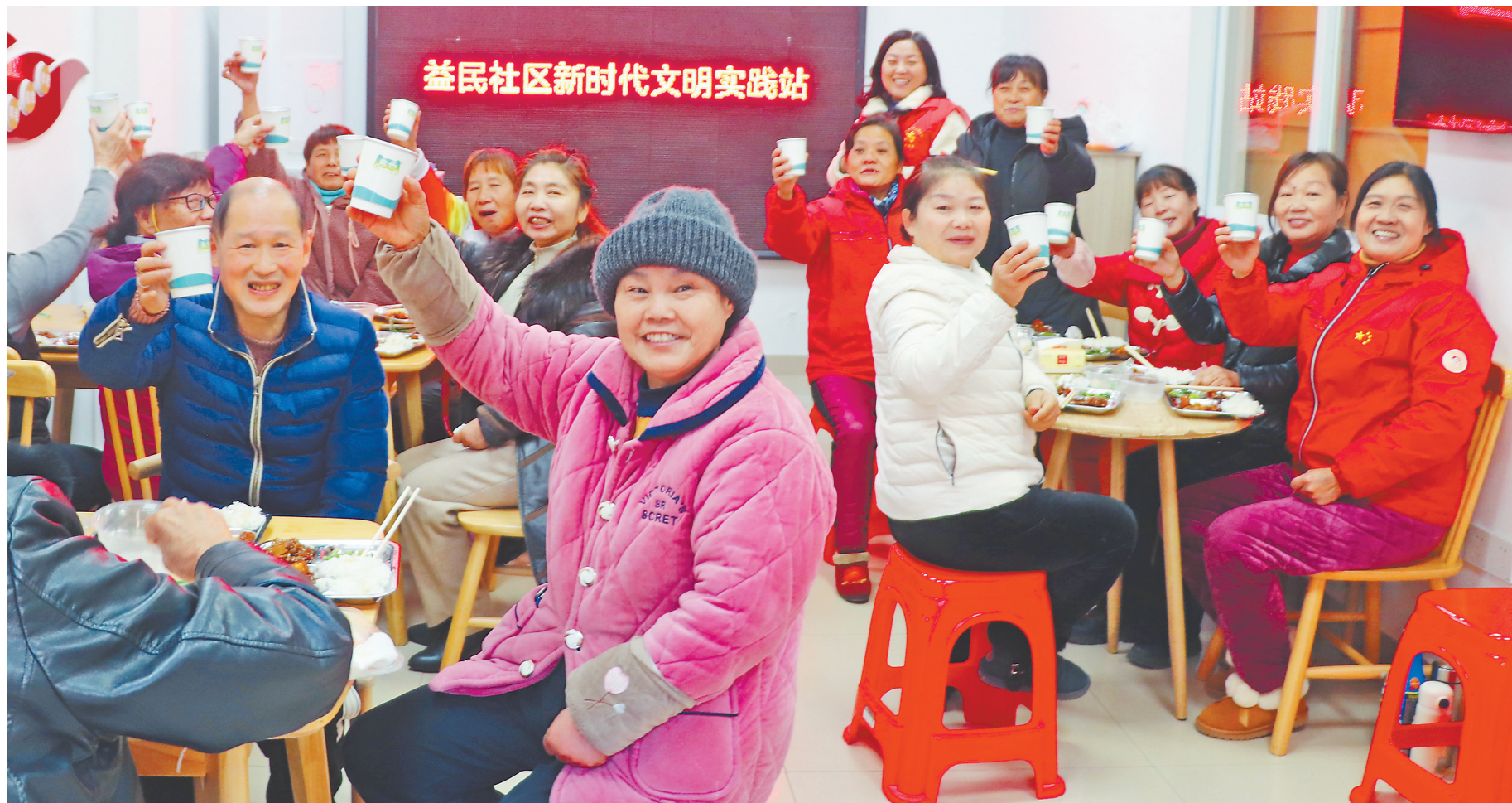
居民在南昌市益民社区爱心食堂开心用餐。