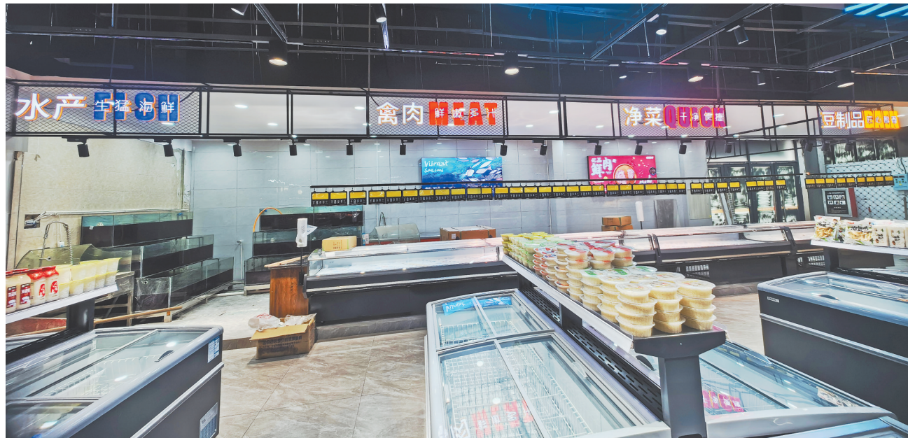
1月2日,原本已经入场的生鲜品类商户因为无法营业又将货物下架。

年10月1日开业后,市场陆续实现“经营数据可采集、收银可统一、产品可溯源”等功能,摊铺入驻率达90%。之后,当地媒体以《首家智慧型农贸市场——乐平市昌平路农贸市场正式开业》为题进行了报道。