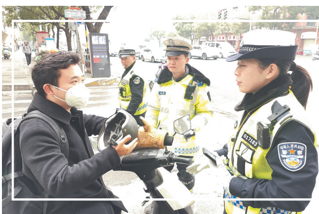
民警对未佩戴安全头盔的群众进行劝导。

南昌市登记上牌电动自行车已达254万余辆,从近三年南昌市交通事故统计情况来看,涉及电动自行车驾乘人员伤亡的事故,因头部受伤致死的占74.75%。业内人士表示,增加电动自行车驾乘人员佩戴