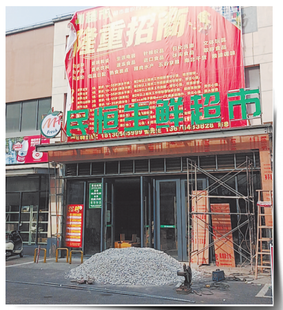
1月2日,即将改造完成的昌平路农贸市场大门口被倾倒砂石。