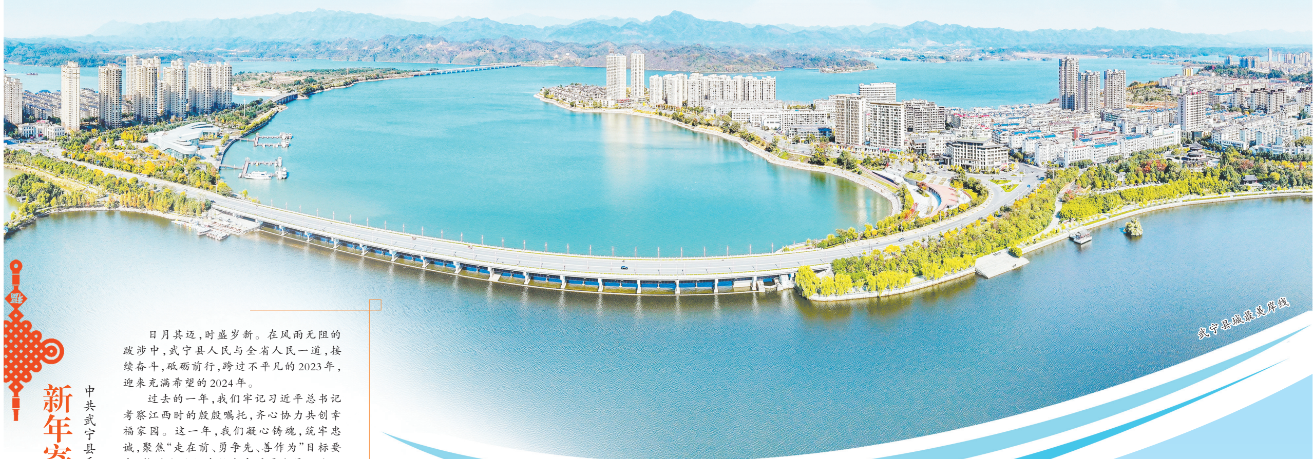
武宁县最美风景线

日月其迈，时盛岁新。在风雨无阻的跋涉中，武宁县人民与全省人民一道，接续奋斗，砥砺前行，跨过不平凡的2023年，迎来充满希望的2024年。