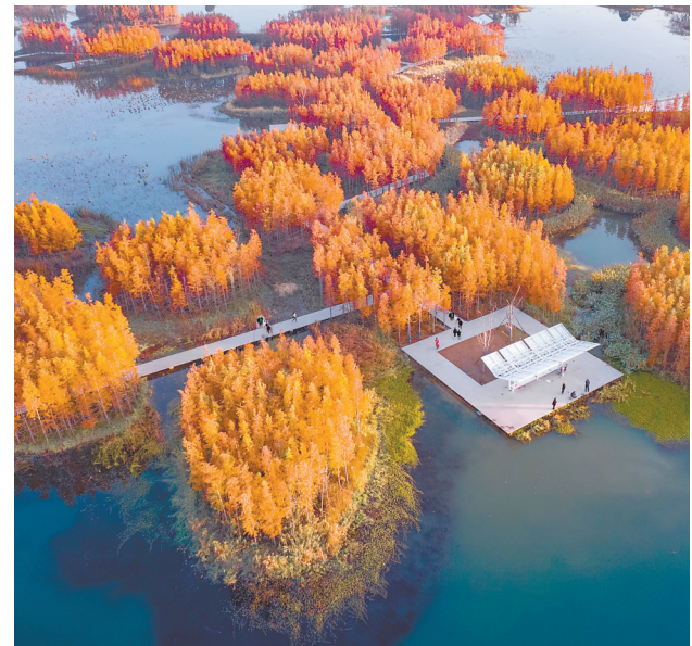
隆冬时节，南昌高新区的鱼尾洲湿地公园美不胜收。