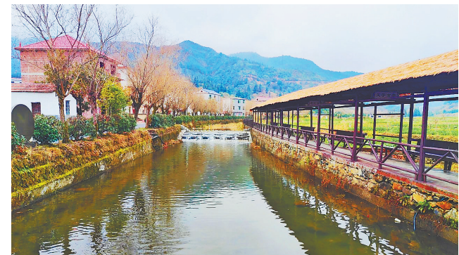
四桂村小河边的亭台楼阁，景色秀美。

冬日暖阳下，走进莲花县南岭乡四桂村，只见干净整洁的沥青路四通八达，穿村而过的清江缓缓流淌，农房整齐划一……一幅美丽宜居、和谐共生的美好画卷映入眼帘。