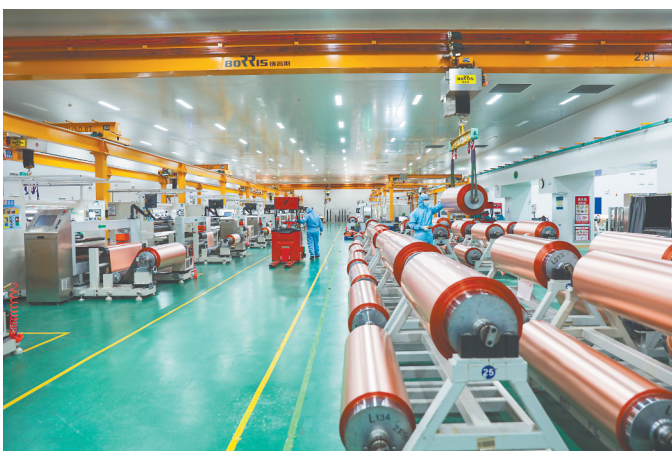
1月16日,位于江铜集团南昌高新产业园的锂电铜箔生产现场,一张张纤薄的铜箔沿着卷轴滚卷而出。