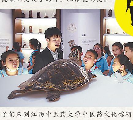
景德镇陶瓷大学的师生在修复陶瓷。