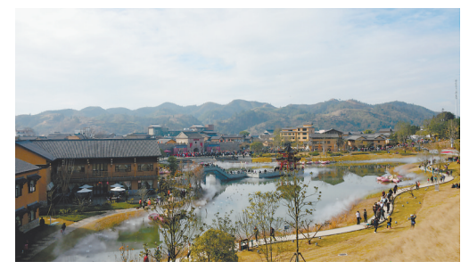
定南客家古城。

岁月见物见生活。穿越455年的历史长河,历经岁月洗礼的客家古城,既古香古色,又新韵迭出。正是古老与现代的交融,让“藏在深闺人未识”的这座城池生生不息,美美与共!