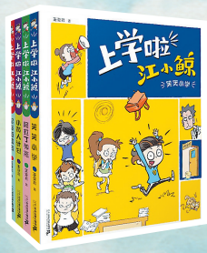
《上学啦，江小鲸》 王亚君 著 二十一世纪出版社集团

有一次割稻子，回来的路上中暑晕倒了，半大的孩子躺在没有云朵的烈日下，许久缓不过来。