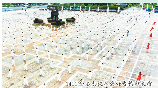
1400余名太极拳爱好者精彩表演

坚持和加强党的全面领导，着力营造良好政治生态。纵深推进全面从严治党，以作风建设和气象激发干事创业新动能。实实在在抓好理论学习、调查研究、推动发展、检视整改、建章立制，深入开展正反典型案例解剖式调研和9个专项整治活动，推动解决一批群众反映强烈的问题，形成一批制度成果。创新开展“红旗党支部”“模范党支部”“红心先锋”活动，让抚州市各基层党组织学有榜样、赶有目标。深入开展“九查九改”干部作风整顿活动，树牢“把个人交给事业、把进步交给组织”的鲜明选人用人导向，持续激发干部队伍干事创业、争先创优的工作热情，努力创造经得起实践、人民、历史检验的实绩。