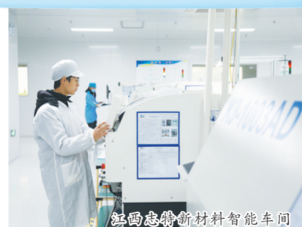
乐尚德新材料智能车间