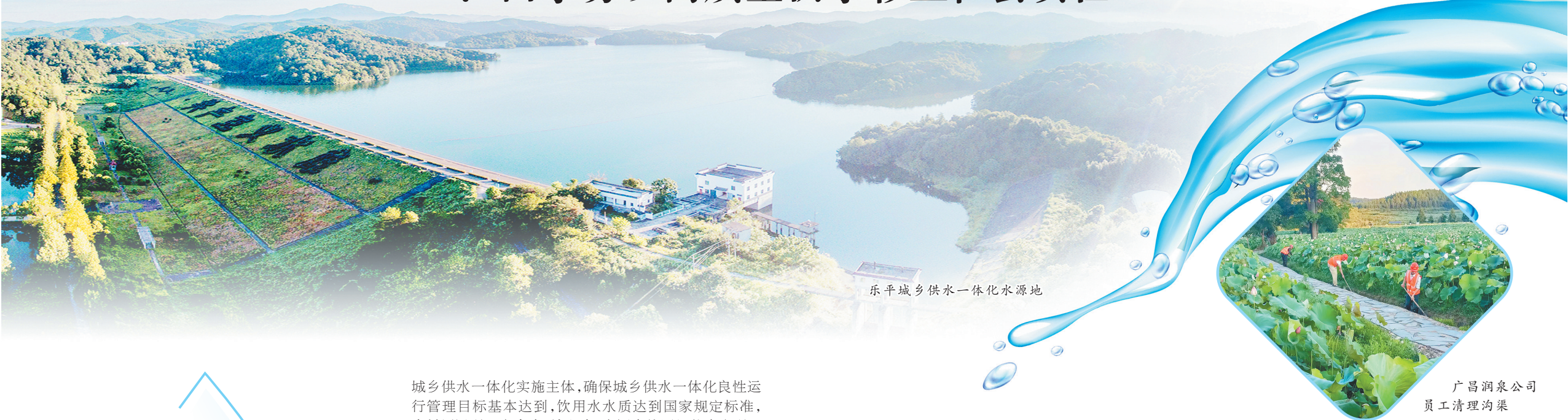
乐平城乡供水一体化水源地