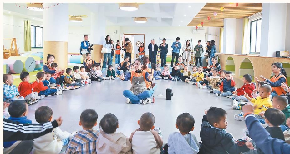
全省托育机构婴幼儿入托补贴标准进一步提高

提高站位服务全局,推动实施“1+N”组团医疗援疆模式,挂牌成立中乍新生儿发展中心、突尼斯中国中医中心,医疗外援工作被国家表彰。