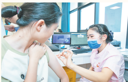
为全省适龄女生免费接种人乳头瘤病毒疫苗