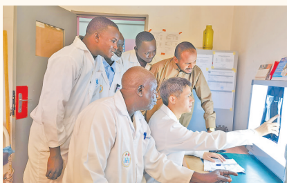
第18批中国(江西)援乍得医疗队队员带教当地医务人员