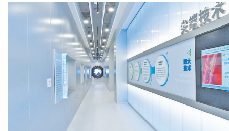
重大疾病新药靶发现及新药创制国家重点实验室

面推进新时代卫生健康人才队伍现代化建设的实施方案》,培养学科领军人才50余名。加速推进“一云一网一平台”建设,基层人工智能辅助智慧医疗系统全面联通上线投入应用。获批全国重点实验室2家、国家临床医学研究中心分中心5家,获批国家自然科学基金项目207项、省科学技术奖励15项,科技奖项数量、质量连续5年稳居全省第一方阵。住院医师规范化培训绩效考核进入全国前列。