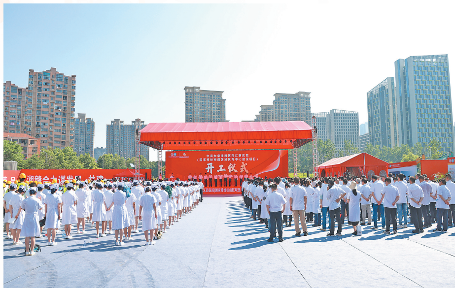
积极争取国家优质医疗资源在江西扩容下

过去一年,全省卫生健康系统各项工作取得积极进展和明显成效,人民群众健康获得感、幸福感、安全感不断提升。《江西省卫生健康服务能力全面提升三年行动计划(2023-2025年)》《关于进一步完善医疗卫生服务体系的实施意见》《关于进一步深化改革促进乡村医疗卫生体系健康发展的实施意见》等重大民生政策相继落地实施,《关于加快推进卫生健康现代化的若干意见》《江西省打造新时代卫生健康“四区四高地”行动方案》等政策框架体系加快形成。