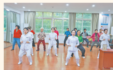
群众在社区卫生服务中心学习八段锦

2024年是实现“十四五”规划目标的关键之年,也是全省的“大抓落实年”,省卫生健康委党组书记、主任龚建平表示,全省卫生健康系统将聚焦“走在前、勇争先、善作为”目标要求,锚定实现江西卫生健康现代化奋斗目标,启动实施“四区四高地”建设八大行动,强化政策、项目、学科、科技、人才、信息六大支撑,推进事业和产业、中医和西医、医疗和预防、生育和养育四大融合创新发展,重点实施“十大创新”“十大攻坚”“十大惠民”举措,努力为群众提供全方位、全生命周期的健康服务。