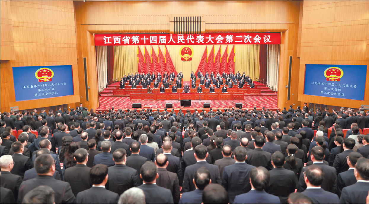
1月26日上午,省十四届人大二次会议圆满完成各项议程,在南昌胜利闭幕。

大会采用无记名按表决器方式,表决通过了关于政府工作报告的决议、江西省人民代表大会关于全力打造国家生态文明建设高地的决定、关于江西省2023年国民经济和社会发展计划执行情况与2024年国民经济和社会发展计划的决议、关于江西省2023年预算执行情况和2024年预算的决议、关于江西省人大常委会工作报告的决议、关于江西省高级人民法院工作报告的决议、关于江西省人民检察院工