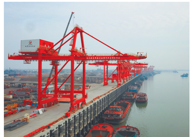
1月28日,无人机航拍南昌港东新港区姚湾作业区综合码头项目建设现场。截至目前,该项目一期主体结构已完工,二期堤内陆域配套工程正在进行陆域堆场及配套建筑设施建设。

中国红十字基金会发起设立的小天使基金人道关怀项目从去年10月起实施,目前已帮助全国1600余名白血病患者家庭缓解了异地就医的交通、住宿、营养补充等经济压力,去年我省有50余名白血病患者获得小天使基金人道关怀项目资助。据了解,该项目资金来源为爱心人士“一只平凡的小猪”的专项捐赠。