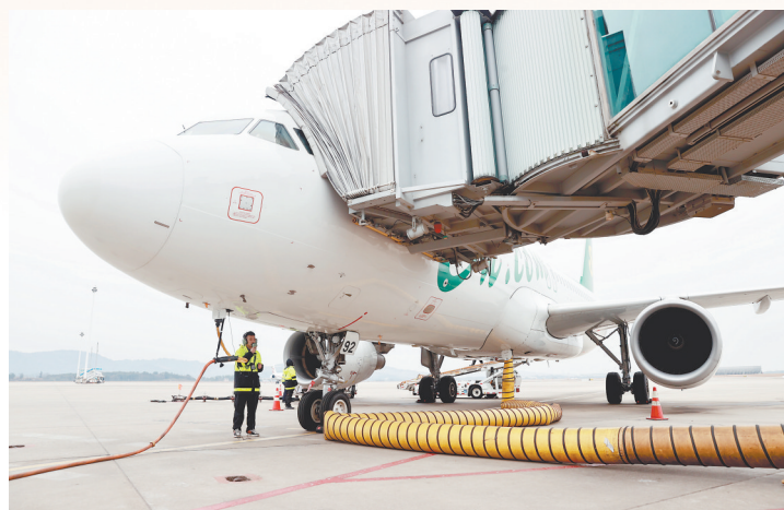
飞机“体检师”对飞机进行故障筛查,为飞机和旅客的安全出行保驾护航。