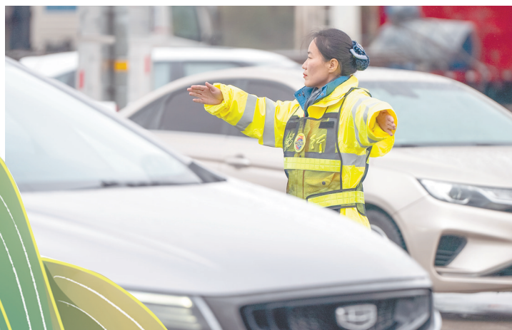
工作人员在高速公路服务区疏导车辆。

记者还了解到,为了保障节日市场供应,南昌深圳农产品中心批发市场组织商户增加米、面、油、菜、果等生活必需品来货量和储备量,还与周边批发市场建立联动保供机制,目前每天可调运3000吨左右的农副产品供应市场。