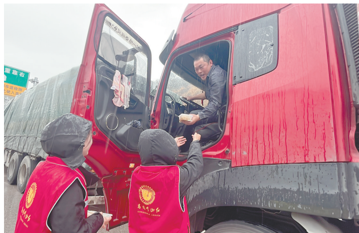
省交投集团景德镇管理中心工作人员冒着大雨为滞留货车司机送餐。

今年春运期间,民航江西空管分局日均保障南昌昌北国际机场起降航班275架次,江西空域飞越航班1484架次,同比增长39.13%和14.99%。“我们行业内有一句话叫We guide you home,翻译成中文就是我们指引你回家。”陈哲思说。空管用自己手中的话筒守护每一次团圆,指引你我,穿越风雪,踏上归家的路途。