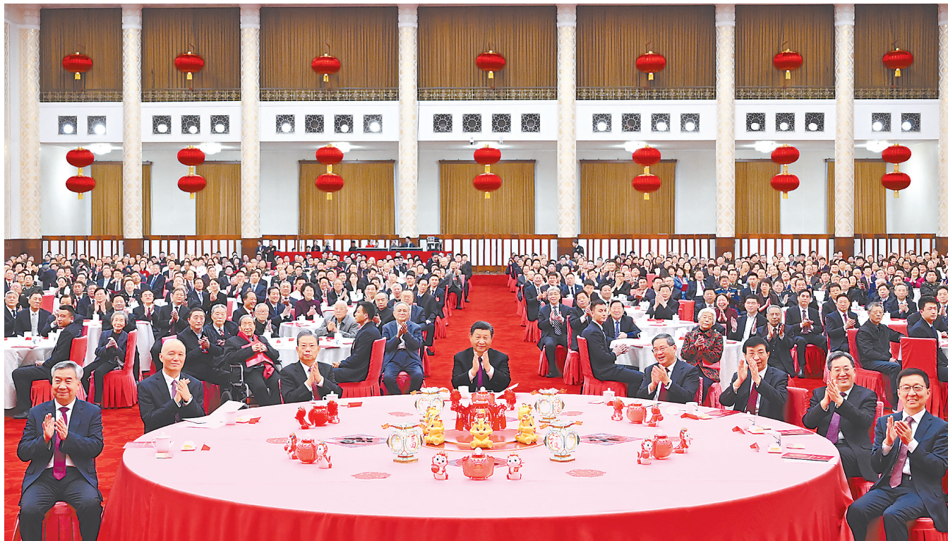
2月8日,中共中央、国务院在北京人民大会堂举行2024年春节团拜会。中共中央总书记、国家主席、中央军委主席习近平发表讲话。