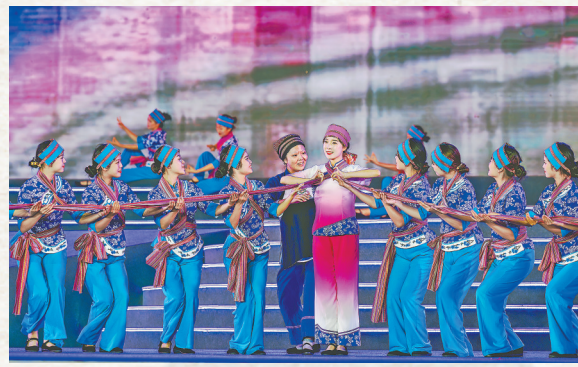
世界客属第32届恳亲大会暨首届客家民俗文化艺术节