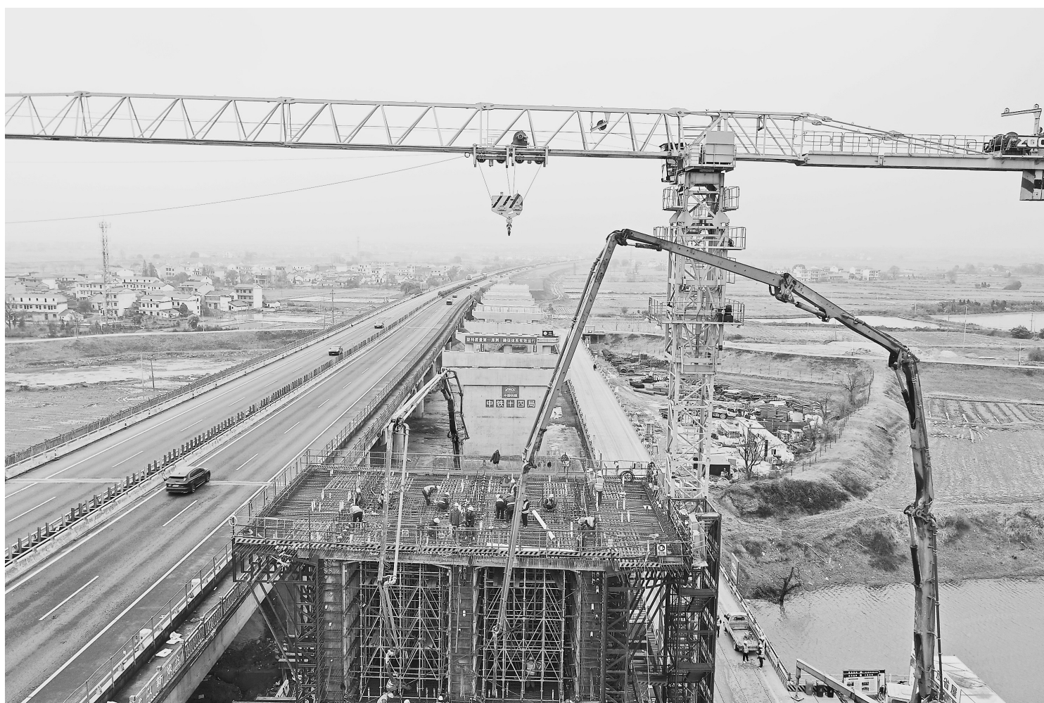
近日,樟吉高速改扩建工程袁河特大桥施工现场一派繁忙景象,工人们正抢抓进度,确保工程如期完成。该大桥是樟吉改扩建工程全线重点控制性工程,全长868米。

此外,加快科技数字赋能。组织实施省级工业发展专项,遴选支持500个左右技改项目,推动低碳技术装备产业化应用。推进“5G+绿色低碳”建设,围绕能源管理、节能降碳等方面,推广一批“5G+”应用场景。华勤电子公司开展“5G+智慧能效管理云平台”,综合能耗降低20%以上;国家“数字领航”企业江铜贵溪冶炼厂,利用数字化技术降低综合能耗7%以上。