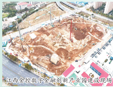
江西金控数字金融创新产业园建设现场

重点聚焦未来科学城等重点区域,集中资源布局新领域、新赛道、新基建,深入挖掘产业发展类项目,积极引入社会投资,激发民间投资活力,持续做大做强项目总盘子。”该负责人说。