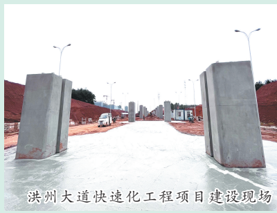
洪州大道快速化工程项目建设现场