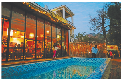
夜幕降临,锄月民宿的游客欢聚一堂。