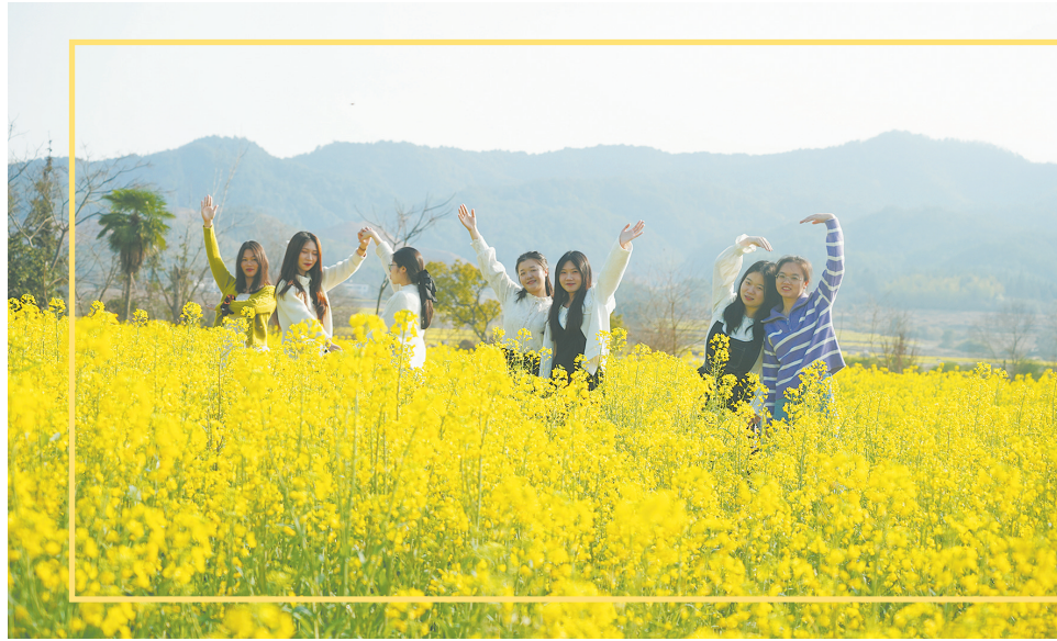
仲春时节,广昌县头枕镇龙虎村道路沿线种植的黄油菜花进入盛花期,大片的油菜花如金色地毯般铺满大地,如画,美不胜收,吸引了众多游人前来踏青赏景、打卡拍照。