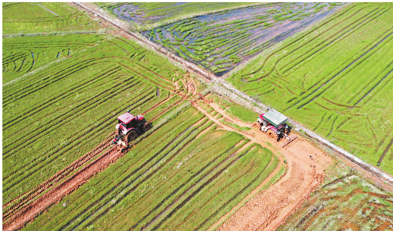
3月11日,在新余市渝水区水北镇伍塘村,村民正驾驶农机在田间劳作。新余各地正抢抓农时,开展春耕生产,田间地头一派农忙景象。