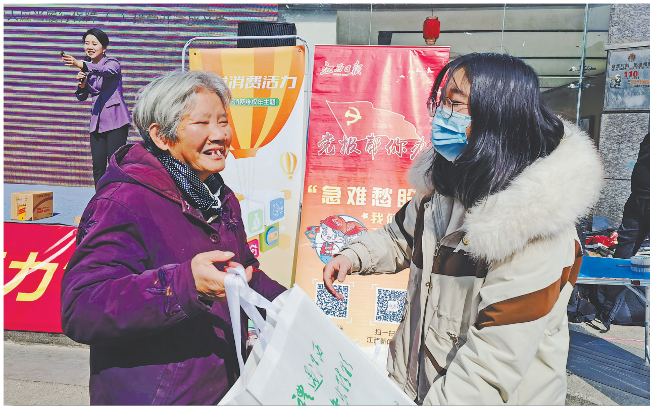
获奖的消费者笑得合不拢嘴。

在第42个“3·15国际消费者权益日”到来之际,本报《党报帮你办》栏目联合省消费者权益保护委员会、美的置业南昌公司(美的公园天下项目)等单位,在苏宁易购八一广场店开展“消费教育进商场”公益活动,并为消费者准备了小夜灯、智能电动牙刷、智能电子秤等礼品,吸引了许多消费者参与。