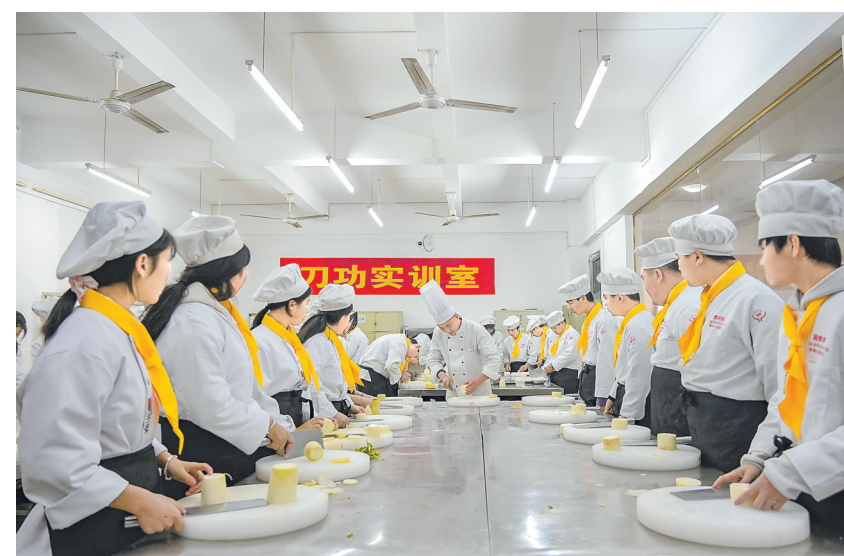
3月13日,在赣州市赣县中等专业学校实训室内,中餐烹饪专业的学生正在学习刀功技法。近年来,赣县区引导各类企业与企业进行职业人才定向培养,实现了职教学生就业水平和适岗能力双提升。

为”的目标要求,着力推动高质量发展,奋力谱写中国式现代化江西篇章。衷心希望中国农业大学一如既往地关心支持江西发展,在种业创新、科技研究、专业学科建设、农业产业化、乡村振兴、人才培养交流等方面加强务实合作,助推江西加快从农业大省向农业强省迈进。 钟登华感谢江西省委、省政府对中国农业大学的大力支持,并简要介绍了学校概况和省校合作情况。他表示,中国农业大学与江西合作基础良好,将聚焦江西所需、农大所长,充分发挥教育、科技、人才等优势,进一步深化与江西务实合作,推进农业科技推广和应用,打造更多科技小院,为江西高质量发展和现代化建设贡献力量。