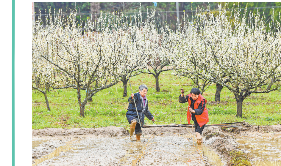
3月14日,定南县龙塘镇湖江村,党员志愿者与村民一道进行水稻育秧。当前,该县广大农民积极开展早稻集中育秧,确保不误农时。

据了解,袁州区持续加大农育基础设施投入,并加强技术培训,鼓励农户采用新技术育秧,提升农业机械化水平。目前,全区早稻育秧已完成可播种面积1万亩。