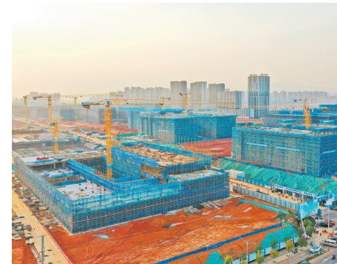
3月12日,在南昌市红谷滩区未来科学城,南昌医学院新校园(一期)项目现场施工正酣。目前,该项目正在进行主体结构施工,预计5月全面封顶。

此次发布的39家单位,将进一步拓展我省享受慈善税收优惠政策的公益性组织范围,有利于稳定捐赠人预期,引导有意愿、有能力的企业、社会组织和个人参与公益慈善事业。