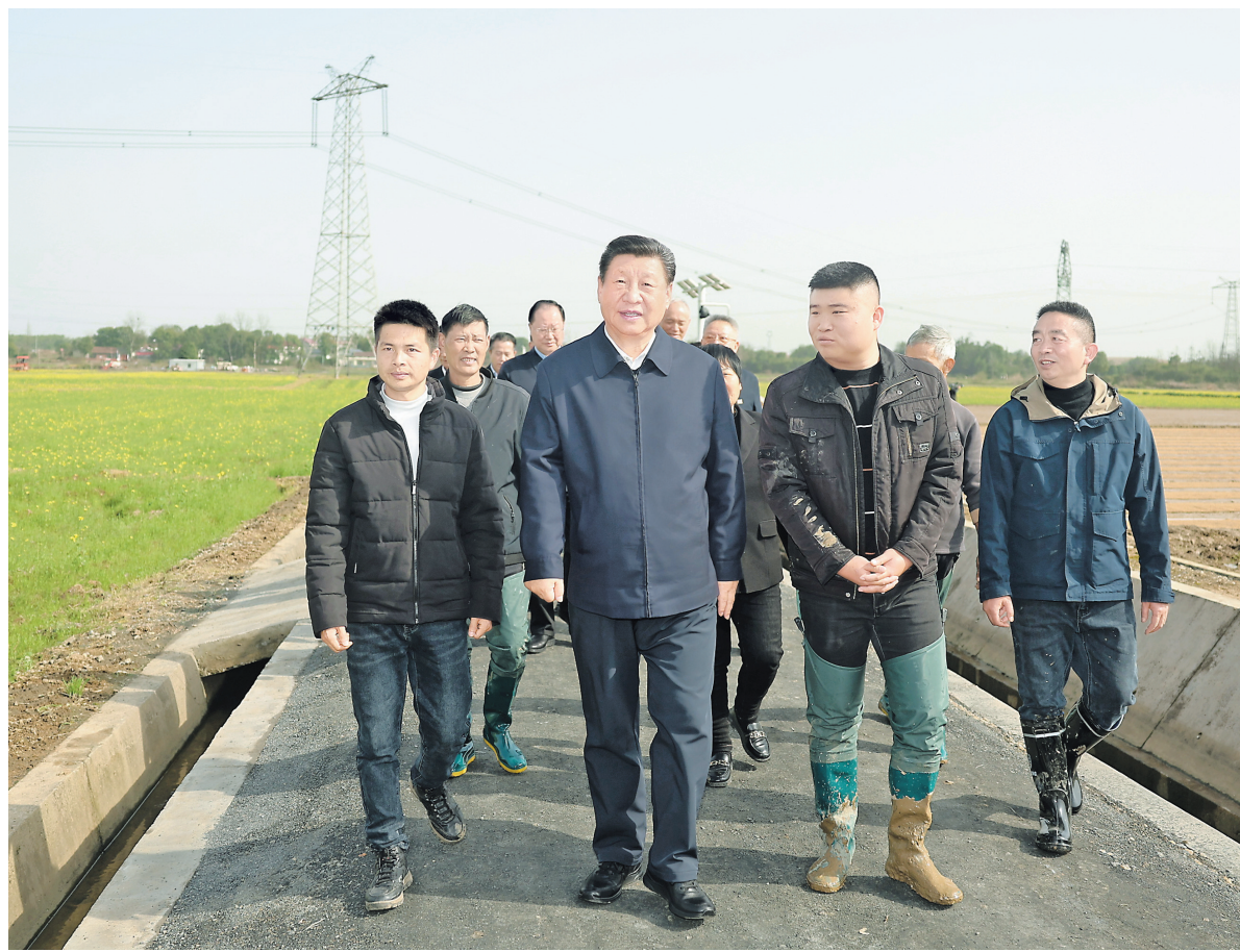
3月18日至21日，中共中央总书记、国家主席、中央军委主席习近平在湖南考察。这是19日下午，习近平在常德市鼎城区谢家铺镇港中坪村，同种粮大户、农技人员、基层干部亲切交流。

■ 学校要立德树人，教师要当好大先生，不仅要注重提高学生知识文化素养，更要上好思政课，教育引导学明德知耻，树牢社会主义核心价值观，立报强国大志向，努力成为堪当强国建设、民族复兴大任的栋梁之材