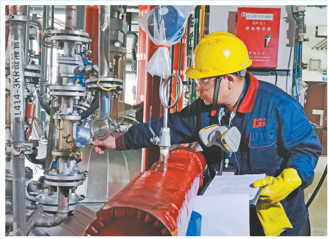
▶江西隆莱生物制药有限公司生产车间,工作人员正在检查机器设备。