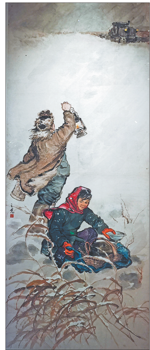
图2:国画《雪夜送饭》杨之光绘

在创作这件作品时,作者进行了适当艺术处理,时间选择在一个月夜,这有助于刻画人物环境和深化主题。渔妇形象采取侧面造型,这样既能看到背上的小孩,又能看到门外的民兵队伍。用直线勾画渔妇的手臂,以显示出她的力量,有一种冲出家门的感受。她警惕的眼神和飘起的背带,均表明即将迎来战斗的紧张气氛。同时,月光下的冷色调环境和渔妇肤色的暖色调形成强烈对比,更加鲜明地突出人物形象。