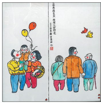
《父母养我长大,我陪父母到老》甘育田绘