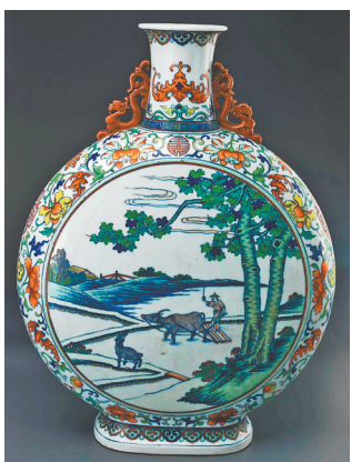
乾隆款斗彩农耕图双耳扁壶

斗彩起源于明宣德时期,是釉下青花和釉上彩瓷相结合的工艺,有争奇斗艳之意。该壶制作工艺精致,釉下青花的轮廓描绘细腻,填色精准,反映出当时瓷器绘画工匠的严谨。壶侧用青花勾纹饰,内填矾红色花卉,间绘蝙蝠、莲花、如意、万寿、蝙蝠图案,寓意家园长庆、福增寿长、吉庆如意。底部写青花“大清乾隆年制”款。题材在官窑瓷器中罕见,造型精美,色彩艳丽,图案新颖,是乾隆官窑中的斗彩瓷器精品。