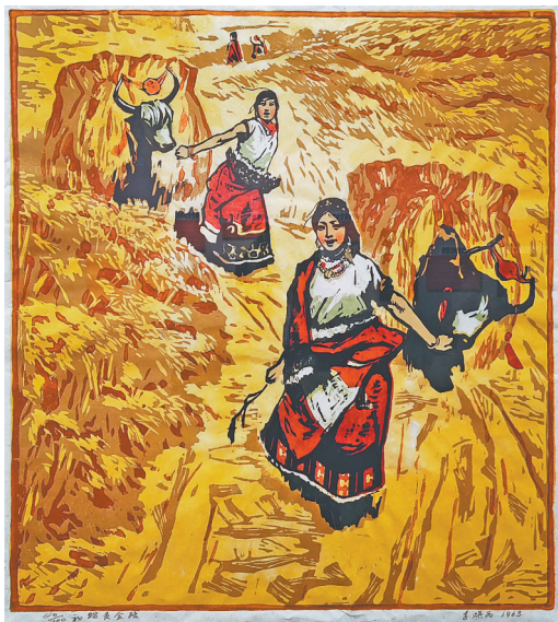
图1:版画《初踏黄金路》李焕民作

“乡土人间——1949年以来乡村题材美术作品研究展”正在省美术馆举行,展出广东美术馆馆藏的100多件美术精品以及《美术》《人民画报》等相关重要文献。展出的作品作者包括关山月、杨之光、李焕民、刘文西、黎雄才、黄永玉等全国名家,有多件作品在全国历年重要赛事中获奖,有的作品还被编入中学美术教材。此展为国家艺术基金传播交流推广资助项目。本次巡展至江西省美术馆,将推动两馆馆际间深度交流与合作,也为我省广大美术爱好者提供了一次极好的学习机会。展期至3月28日。