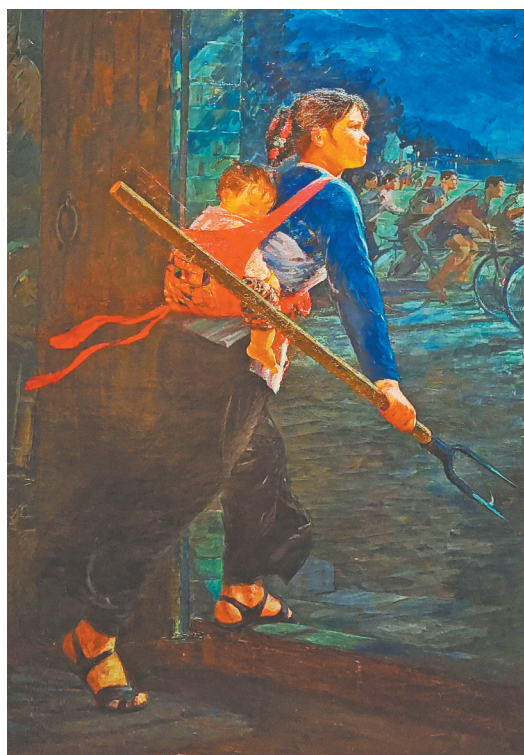
图3:油画《螺号响了》邵增虎绘