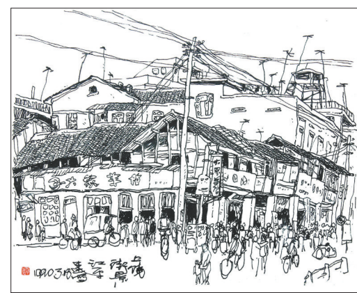
速写《上饶市区老街口》(1990年)