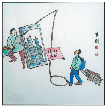
《全民反诈》廖宝鼎绘