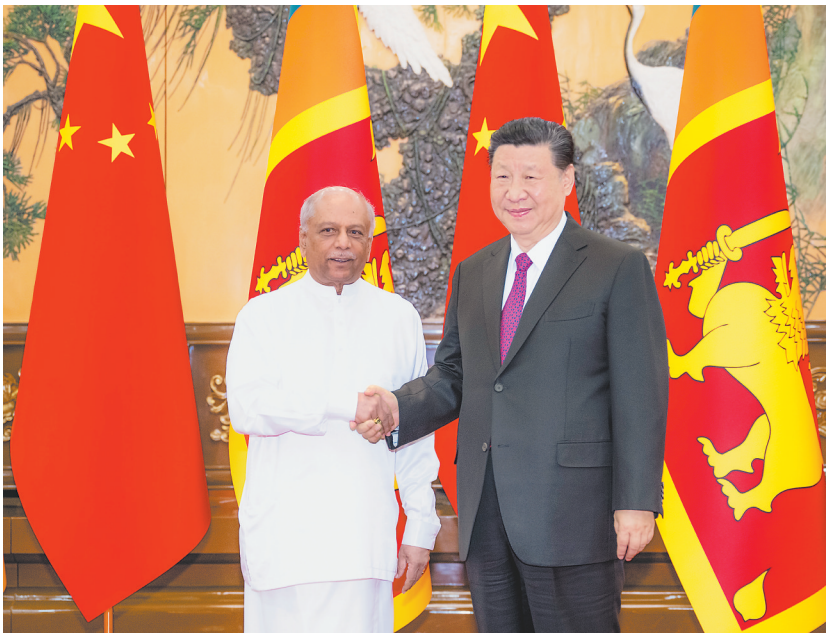
3月27日下午,国家主席习近平在北京人民大会堂会见来华进行正式访问的斯里兰卡总理古纳瓦德纳。

新华社北京3月27日电(记者郑明达)3月27日下午,国家主席习近平在人民大会堂会见来华进行正式访问的斯里兰卡总理古纳瓦德纳。