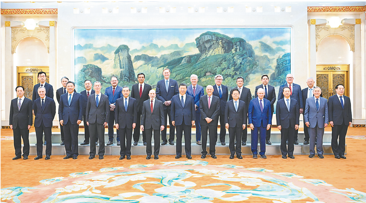
3月27日,国家主席习近平在北京人民大会堂集体会见美国工商界和战略学术界代表。