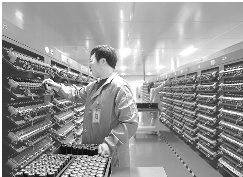
3月27日，位于上犹工业园数字化新能源产业园的江西恒森数字能源技术有限公司生产车间内，工人正在给注液后的电池进行首次充放电作业。近年来，上犹县奋力打造新能源产业集群区，目前已有19家新能源电池、新能源汽车零配件企业。

《管理办法》的出台，是推动我省制造业由大变强的现实需要。我省从2004年开始部署省级产业集群培育发展工作，截至2023年，累计培育136个省级(含培育、特色)产业集群，实现营业收入约3.5万亿元，占全省开发区营收比重九成以上，成为全省工业高质量发展的重要支撑，也是培育发展先进制造业集群的坚实基础。