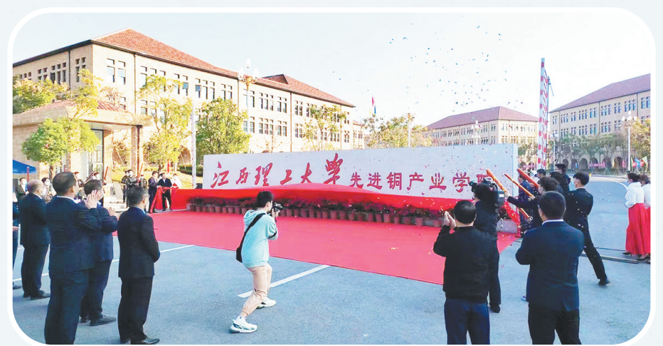
江西理工大学先进铜产业学院