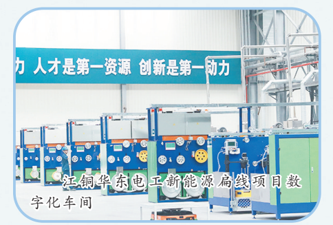
江铜华东电冶新能源铜箔项目数字化车间