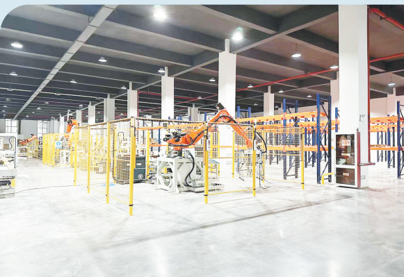
贵溪中易高精年产3万吨电子级铜基新材料项目正在进行设备调试