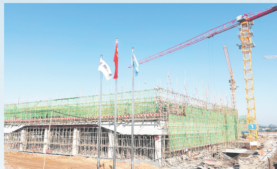
总投资50亿元的贵溪国人通信产业园项目正在施工