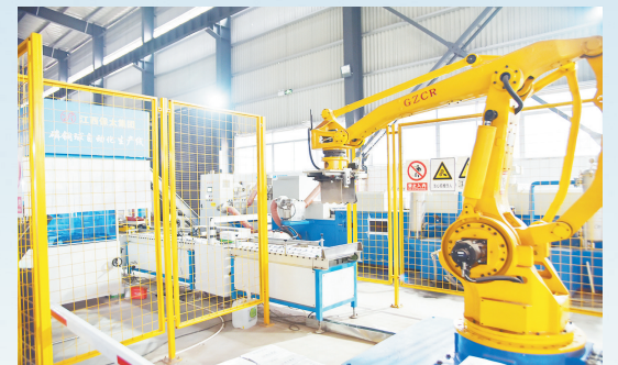
保太集团智能化改造后产能大幅提升,跃居江西民企100强