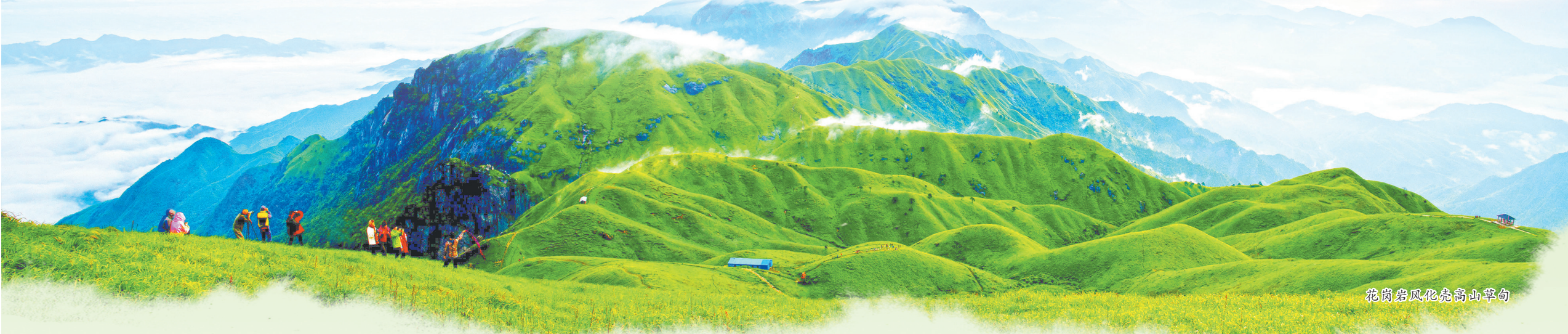
花岗岩风化壳高山草甸

武功山自古便是江南三大名山之一,享有“衡首庐尾武功中”的美誉。江西武功山世界地质公园作为全球唯一以花岗岩穹隆构造为主体,呈现整体地质地貌景观的地质公园,以其独特的自然禀赋、人文特色,绿色的生态文明等,被称为大自然的天然博物馆。