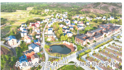
农旅融合示范村——弋阳国际文学村

人勤春来早，奋进正当时。新的一年，弋阳县将继续坚持产业兴农、质量兴农、绿色兴农，做强做优特色产业，集中力量发展“五个十万亩”特色产业，因地制宜培植发展适销对路的蔬菜、中药材、特种水产等新特优产业，积极创建甲鱼（龟鳖）优势产业集群。深化开展“头雁领航 雏鹰振飞”行动，在农业高质量发展之路上踔厉奋发、勇毅前行。