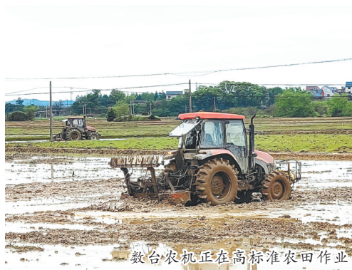
数台农机正在高标准农田作业

作为全省粮食生产重点县，弋阳县坚决扛稳保障粮食安全的政治责任，深入实施“藏粮于地、藏粮于技”战略，全面加强农业基础设施建设，巩固提升粮食产能，牢牢守住粮食安全底线。2023年，全县粮食作物播种面积55.94万亩，产量20.81万吨，实现“二十连丰”。种好粮先要育好秧，为提升秧苗生产效率和品质，弋阳县引进了国家级农业产业化龙头企业——鄱阳湖生态农业股份有限公司，共同打造全省一流的水稻智能化育秧工厂，实现选种、浸种、催芽、播种、秧苗生长管理全程智能控制。