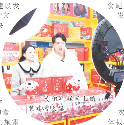
弋阳年糕网上销售非常火爆

制定产业高质量发展实施意见，与江西农大深化校地合作，共建大禾谷品种国家试验基地和大禾谷标准化种植示范基地，推动产业有力提升。加快构建弋阳“粮头食尾”“农头工尾”农业全产业链发展格局，实施“头雁领航 雏鹰振飞”行动，投资1.5亿元的万亩稻油现代农业产业园和南岩千亩高标准农田种植示范项目，建成集育、耕、种、管、收、烘、加、销等于一体的现代农业产业园，着力打造现代化高标准农田示范项目。总投资约1.2亿元的弋阳“玉见莓好”农旅示范园项目，采用空中立体栽培模式，从国外引进顶级连栋智能温室和悬挂式可升降空中草莓滴灌栽培技术，蔬菜实现四季常供，全力打造“农业种植+工业化生产+观光旅游+科普研学”现代化农业产业园。