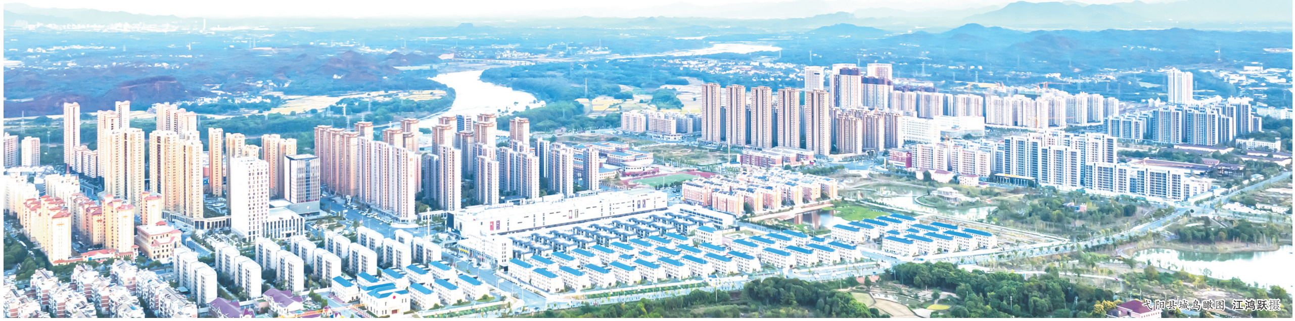
弋阳县城鸟瞰图