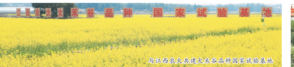
与江西农大共建大禾谷品种国家试验基地