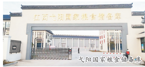
弋阳国家粮食储备库