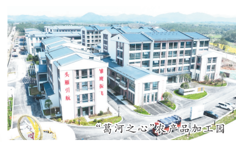
“葛河之心”农产品加工园