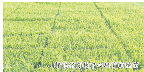
智能化育秧中心培育的秧苗