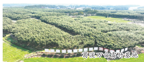
清湖万亩育秧基地