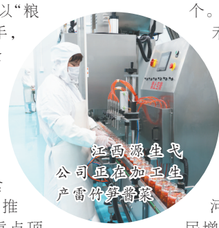
江西原生弋公司正在加工生产雷竹笋

联农带农、三产融合。葛河之心农产品加工园以促进农民增收为出发点，提前谋划，引导入园企业建立“公司+基地+农户”的联农机制。江西大禾农业产业有限公司通过订单模式建立大禾谷基地3000亩、康之缘公司建立大禾谷基地2000亩，原生弋公司与雷竹大户签订雷笋收购协议，直接带动1500余户农户增收。