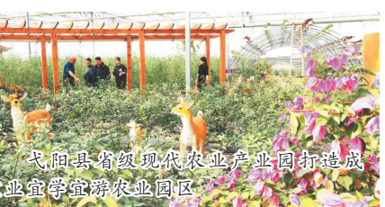
弋阳县省级现代农业产业园打造成宜业宜学宜游农业园区