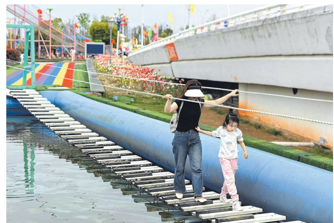
3月30日，在南昌团园中心亲子乐园，不少父母和孩子们一起参加各种游乐活动，共度周末时光。

按照要求，2024年6月底前，2023年城镇老旧小区改造计划任务全部完工；8月底前，各地2022年结转的公共租赁住房、棚户区改造高层建筑续建项目和2023年结转的公共租赁住房、棚户区改造多层建筑续建项目全面达到基本建成要求；10月底前，各地2021年结转的保障性租赁住房高层建筑续建项目和2022年结转的保障性租赁住房多层建筑续建项目全面达到竣工要求。