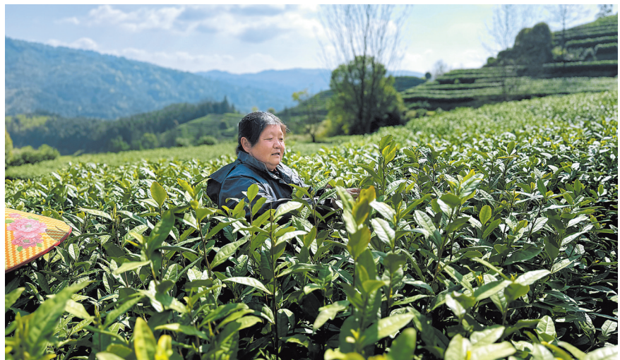
腾丰村的采茶工正在抓紧采摘“明前茶”。

“采茶去咯！”3月26日一大早，靖安县水口乡腾丰村村民结伴前往南岑采茶基地，声音在整个山谷环绕。每年3月，早茶飘香，腾丰村上百名采茶工都会忙个不停，抢收头道好茶。