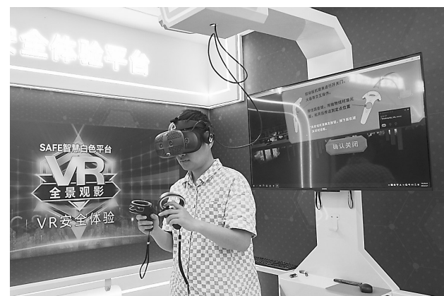
4月1日，一家企业的职工在位于赣州经开区的赣州市工伤预防警示教育基地操作VR设备。该基地运用信息技术手段，对工人作业现场常见的危险行为和事故类型进行讲解，向广大职工普及工伤预防知识。

本报黎川讯（通讯员张亚平）“同学们，着火啦！快，走这边，不要乱，有序撤离！”近日，在党员志愿者的引导下，黎川县新城实验学校的师生低头弯腰，迅速有序地按照消防应急疏散演练路线撤离到指定地点。“3分31秒。这次应急疏散演练顺利完成，达到预期目标。”演练总指挥按下秒表，赞许地说。 今年以来，黎川县积极开展党建引领消防安全“三进三帮”活动，即消防安全进学校，帮助夯实安全意识根基；消防安全进社区，帮助增强应急自救能力；消防安全进企业，帮助筑牢安全生产防线。该县组建专项检查组，对城市社区、中小学校、企业、超市等人员密集场所开展专项检查，结合辖区消防安全实际，建立健全信息共享、情况通报、联合查处等工作机制，对检查中发现的违法行为依法整治；督促相关物业服务企业落实防范措施，积极开展防火巡查检查、落实消防安全管理责任、维护消防设施等，及时将火灾隐患消灭在萌芽状态；开展消防安全知识培训、消防应急演练综合演练，提升社区工作者、物业企业人员、学校师生、企业消防安全责任人和管理人等重点领域人员应对和处置突发事件的能力。截至目前，黎川县组织消防应急综合演练19次，开展消防安全宣传、培训6300余人次，发放宣传资料3万份。