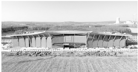
图片均为4月9日拍摄的伊春西站施工现场。