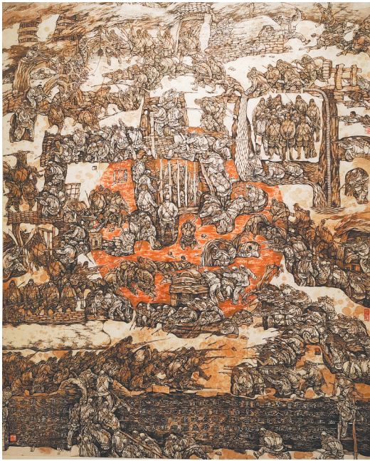
国画《地道战》贺荣敏绘