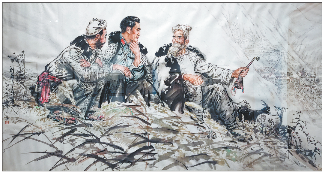
国画《刘志丹》刘文西绘