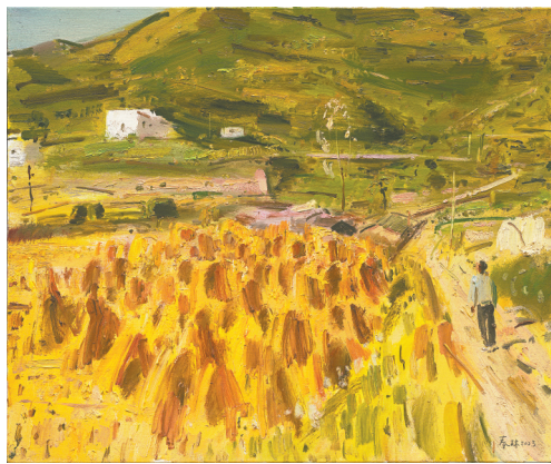
布面油画《向天歌》(50cmx60cm)朱春林绘