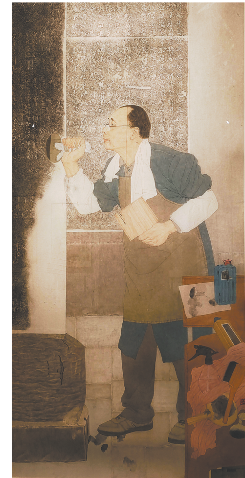
国画《碑拓》录洁图绘

由陕西省美术博物馆和江西省美术馆主办的“时代长安——陕西当代中国人物画研究展”，自4月3日始在江西省美术馆开展，展出陕西当代中国人物画代表性画家和新锐画家的作品100多件。展览将持续至5月3日。