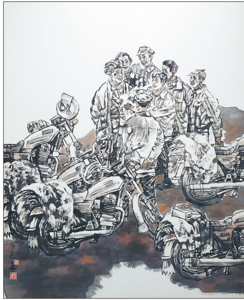
国画《集市》刘永杰绘