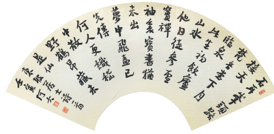
行书扇面《东坡诗》黄阿六书