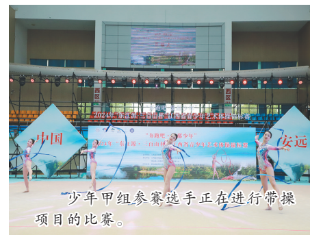
少年甲组参赛选手正在进行带操项目的比赛。