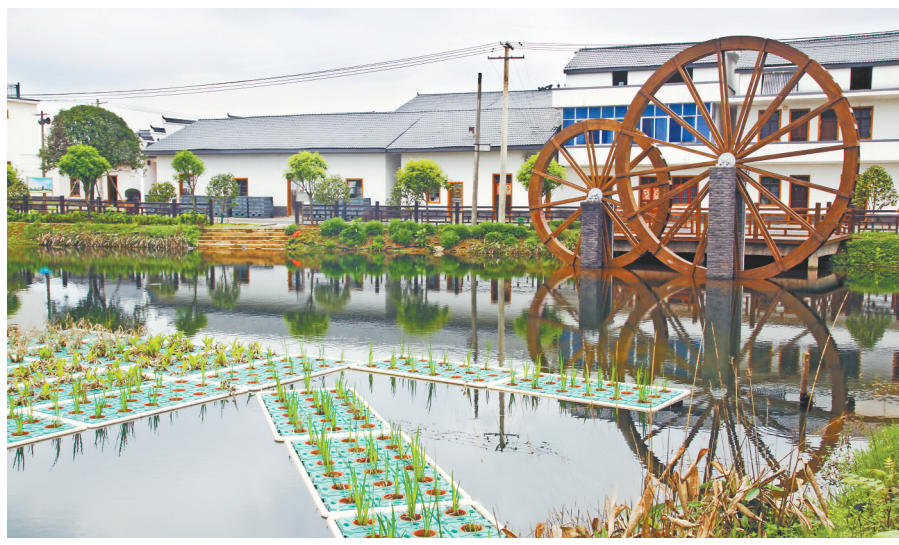
整治后,村里的水塘变美了。