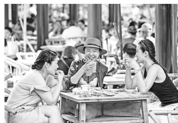
在成都市人民公园内的鹤鸣茶社，人们在喝茶聊天休闲(2021年6月30日摄)。