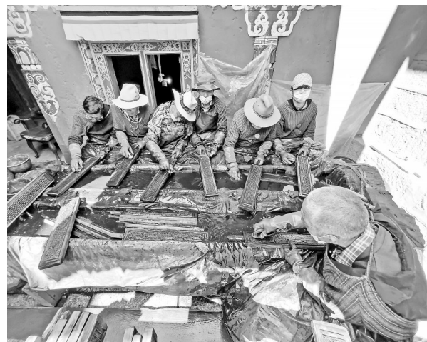
在位于四川省甘孜藏族自治州德格县的德格印经院，工人按照传统做法清洗、保养院藏雕版(2021年10月3日摄)。