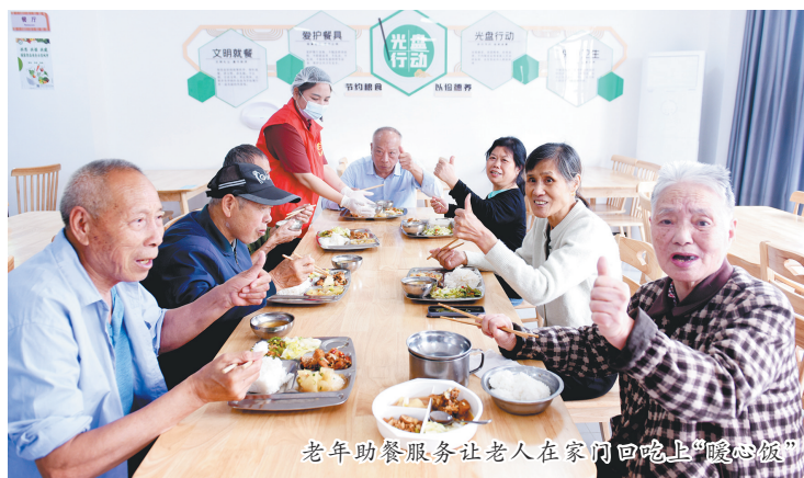
老年助餐服务让老人在家门回吃上“暖心饭”