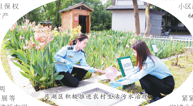
月湖区积极推进农村生活污水治理

城市功能品质持续提升,新增各类停车位2000个,设置便民摊点50个。获评全省城乡环境综合整治先进县(市、区)。月湖区紧紧抓住鹰潭市全域列入国家城乡融合发展试验区的契机,积极推进农村生活污水治理,助力乡村生态振兴。2023年以来,月湖区先后投入资金800余万元,高标准建成角山等6个村点的农村污水治理设施,全区农村生活污水治理覆盖率达60%,位居全省前列。