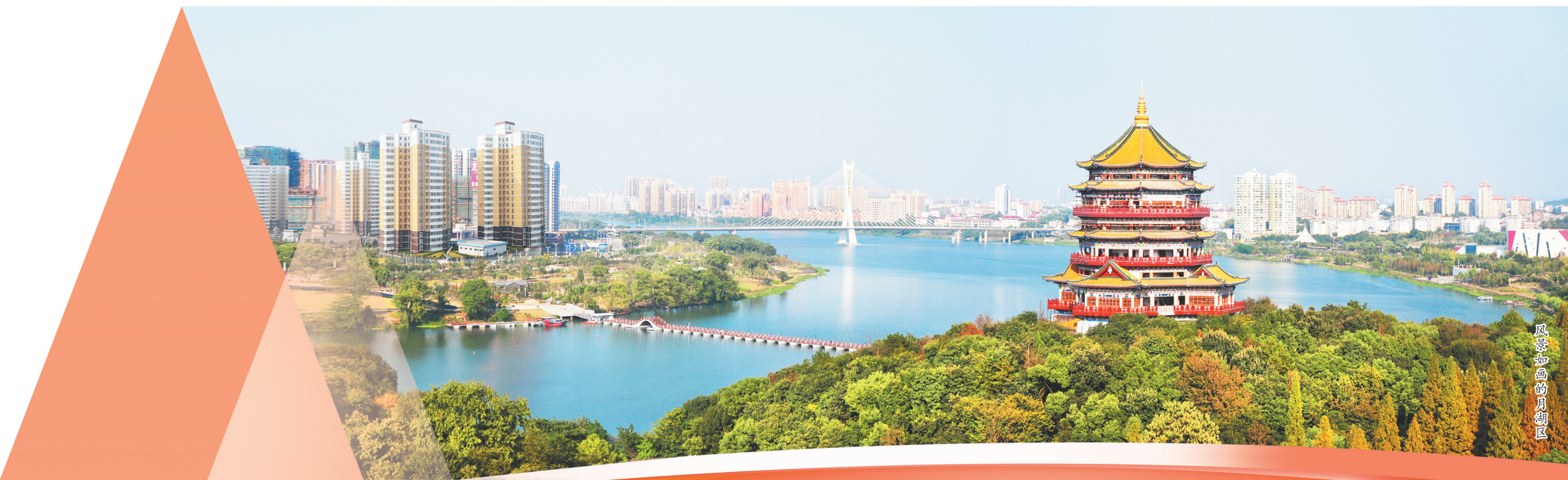
风景如画的月湖区