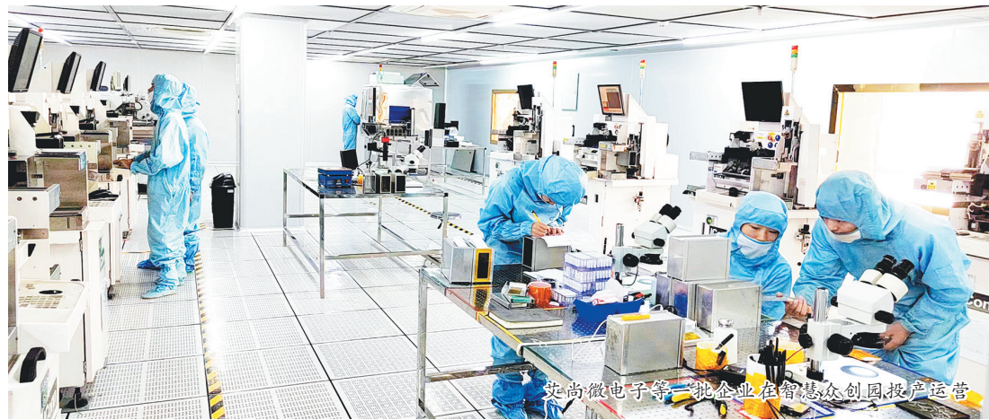
鹰高微电子等一批企业在智慧众创园投产运营

改革创新不断深化。月湖区坚持把改革创新作为优化营商环境发展的动力之源,着力打造科技创新平台,建成省级工程技术研究中心1个、院士工作站3个;加大科技型企业梯度培育力度,新增高新技术企业3家、科技型中小企业21家、专精特新企业1家,实现该区专精特新企业零的突破。大力实施人才强区战略,建设人才公寓,出台人才引进培养奖励细则,进一步优化人才服务保障。出台《月湖区鼓励科技创新发展奖励办法》,2023年兑现奖励资金31.7万元。