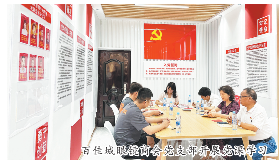
百佳城眼镜商会党支部开展党课学习

凝心聚力,打造流动党员管理平台。月湖区通过建立“流动党员之家”,打造开放式综合服务阵地。全面开展党员“双找”行动,引导流入党员主动亮身份、作表率,共组织流入党员集中学习、交流研讨16次,领办志愿服务、帮扶解困等实事130余件,进一步增强了流动党员的归属感和凝聚力,发挥了党员先锋模范作用。