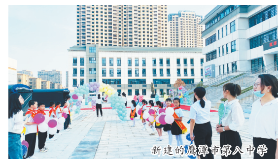
新建的鹰潭市第八中学