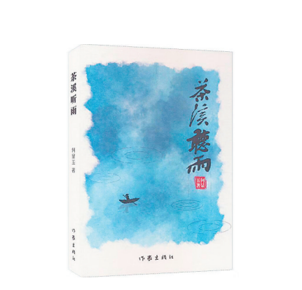
▲《茶溪听雨》 何显玉 著 作家出版社

散文通常是作者人格、生活方式的再现，文中的生活闲语往往是作者某时某刻的真实感受。何显玉写阅读、吃茶、熬粥、种瓜、摸鱼捉虾等小而微的日常生活；也写茶溪、何园、秋色、冬荷、茶叶、艾草等自然万物。他用散文的形式，细腻的笔触描摹“弯腰也是生活”，跟大自然之间重新建立起“心灵的牧场”，表达了他对生命、自然和人文的感悟和思考，探究了人生的意义与价值。