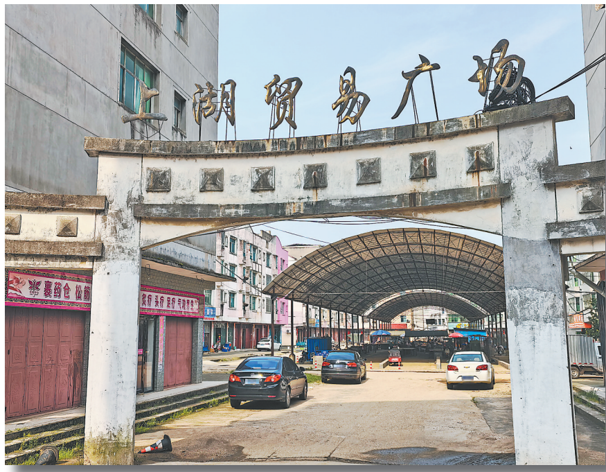
农贸市场使用了 21 年, 12 宗土地仍未提供。

本报全媒体记者 付强 邮箱:307237420@qq.com 微信号:307237420