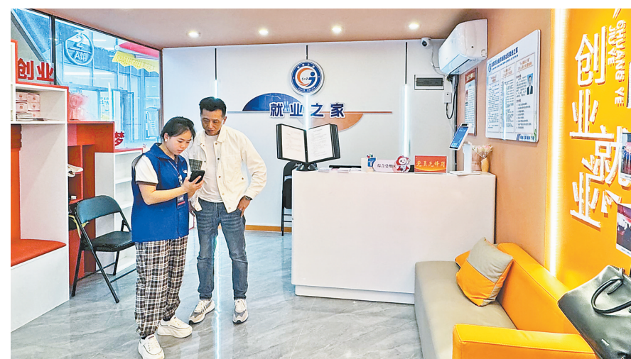
“5+2就业之家”负责人指导企业人员发布招聘信息。