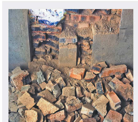
砌墙的砂浆疏松，用手指就能抠掉砖块。

近日，宜春市袁州区柏木乡更石新村村民反映，村里的安置房还未入住，就出现混凝土疏松、房屋漏水、承重墙开裂等问题，当地政府对安置房进行维修和整改后，屋内外全是“补丁”，房屋质量问题一直未彻底解决。5月20日，本报记者赴更石新村进行调查采访。