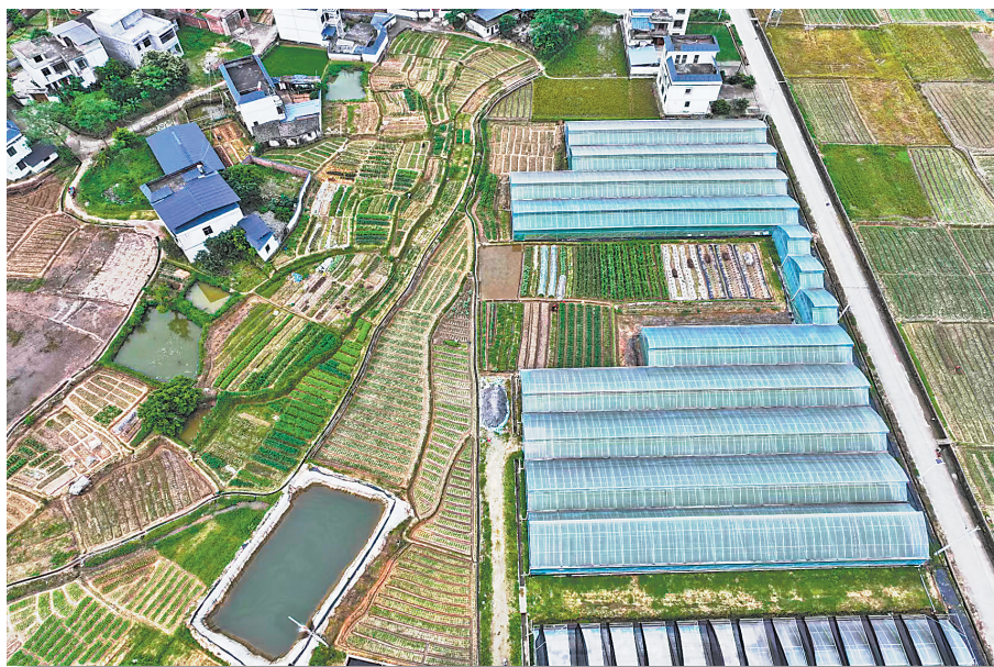
水口村自然之星有机蔬菜基地。

过去，水口村的蔬菜是零敲碎打、分散种植的，时令蔬菜只供给县城周边，菜农赚钱不多。现在，江西自然之星农业科技公司与鑫马鲜生、山姆会员店、百佳、永旺、天虹等商超签订直供协议，让蔬菜销售重心向大湾区市场转移，向高端市场挺进。