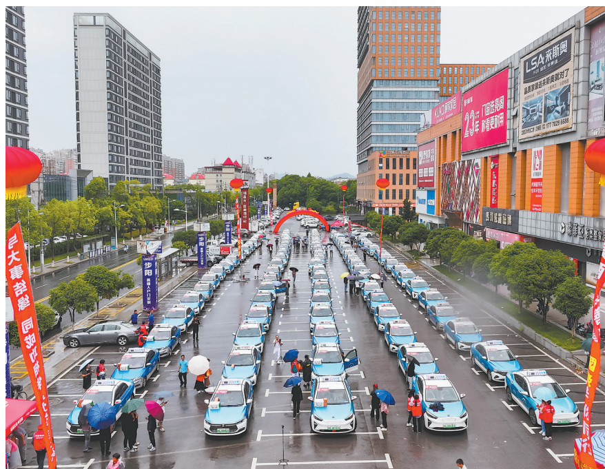
6月4日，瑞昌市100多辆爱心送考车整齐排列，准备高考期间参加免费送考志愿服务。特约通讯员 魏东升摄

加强经济运行监测预警。省统计局构建部门联动、上下协同的分析研判机制，加大数据挖掘力度和分析研究深度，紧盯重点指标、重点领域、重点行业进行高频监测，科学研判经济运行态势，准确反映经济运行中趋势性、苗头性、倾向性问题。（下转第2版）