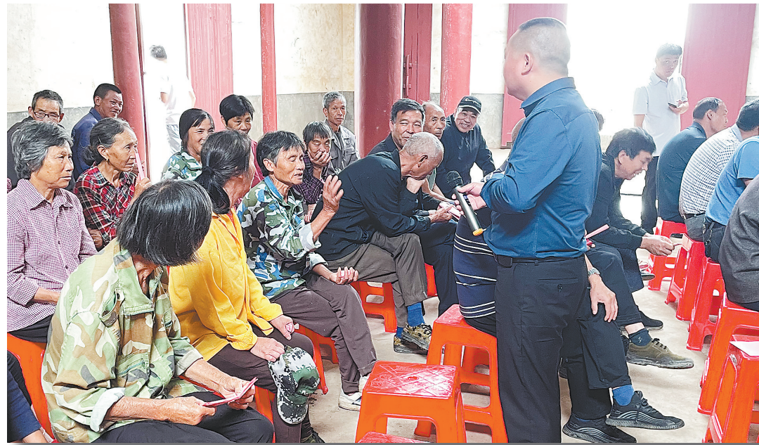
群众在“民事直达”现场会提出问题。

本报全媒体记者 蔡颖辉 邮箱:48505265@qq.com 电话:18679958802