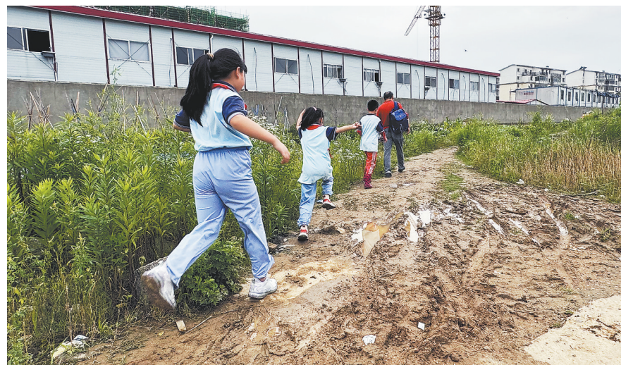
由于道路上到处是泥坑，不少学生都要跳着走。本报全媒体记者 陈璋

作为民园路项目建设的监督管理单位，南昌青山湖投资集团有限公司相关负责人介绍，由于青山湖大道至民营大道使用的一期出让的地块，民园路作为地块使用的配套设施，被列入南昌城市总体规划，设计长度850米、宽度40米。“2022年，南昌市土地储备中心明确包括民园路在内的7条道路由青山湖投资集团有限公司代建后，我们陆续进行了施工前期工作，包括地下管线综合规划、项目