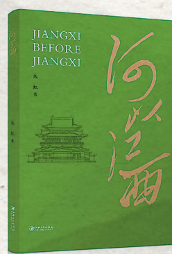
《何以江西》 朱虹著 江西美术出版社