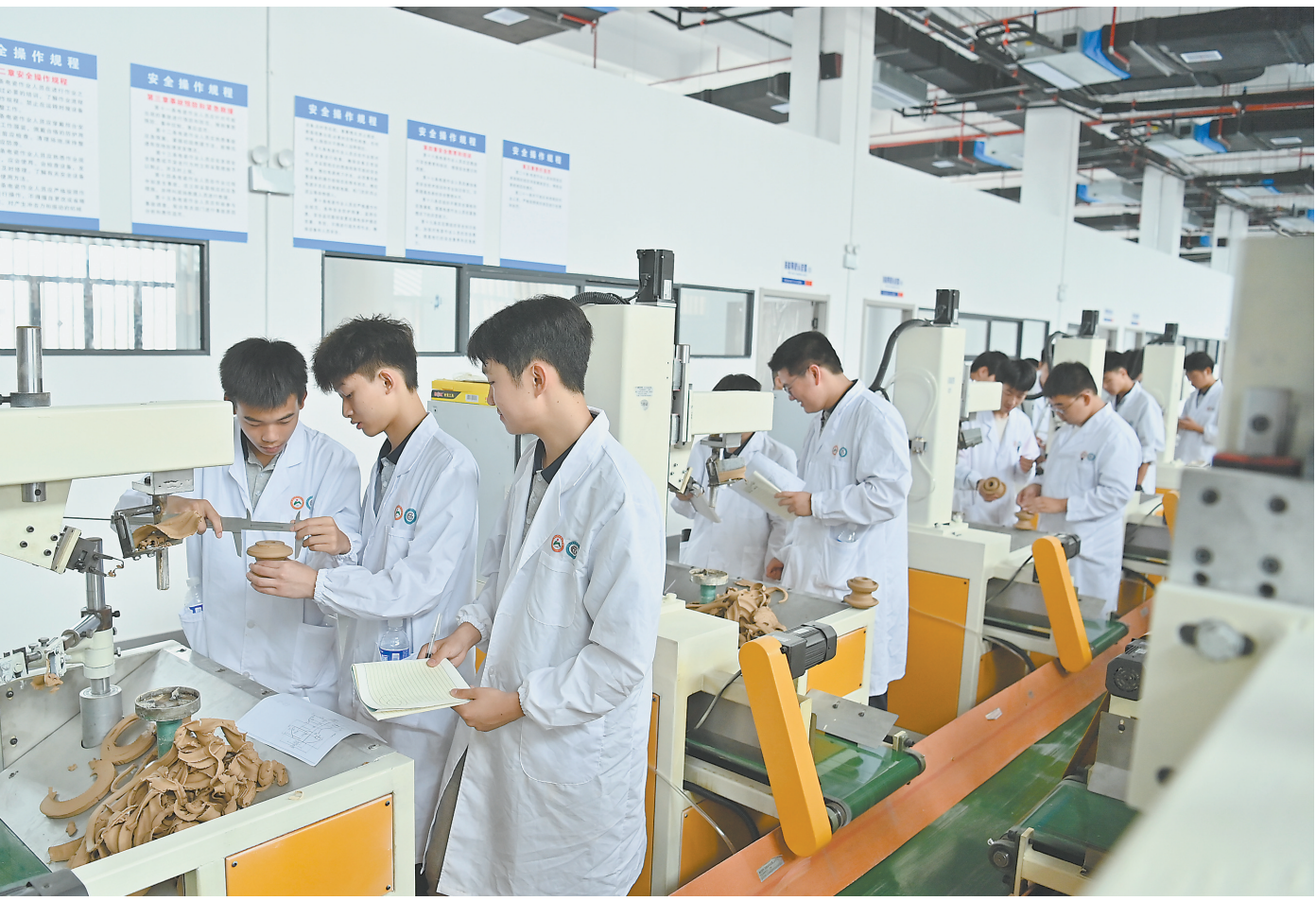
“党群会客厅”服务真贴心