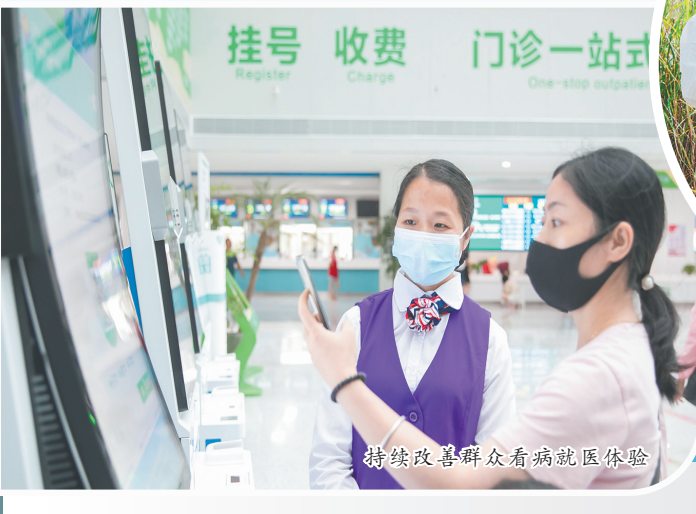
持续改善群众看病就医体验