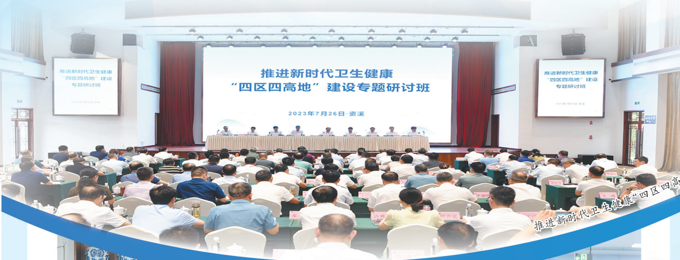
推进新时代卫生健康“四区四高地”建设专题研讨班现场

党的十八大以来,全省卫生健康系统深入贯彻落实习近平总书记关于卫生健康工作重要论述、重要指示批示精神和考察江西重要讲话精神,紧紧围绕省委打造“三大高地”、实施“五大战略”,坚持把高质量发展作为首要任务,助推省委、省政府出台《关于加快推进卫生健康现代化的若干意见》,谋划确定了建设新时代卫生健康“四区四高地”的目标任务,每年以“十大创新举措、十大攻坚行动、十大惠民政策”为主要抓手,强化政策、项目、学科、科技、人才、信息等要素保障,努力改革创新卫生健康事业、推进卫生健康惠民利民,全力护佑人民群众生命健康。