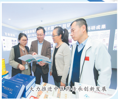
大力推进中医药传承创新发展