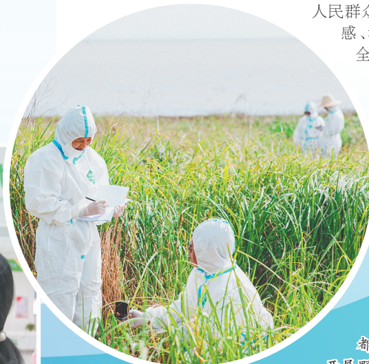
都昌县血防站积极开展野生动物传染源监测和风险评估