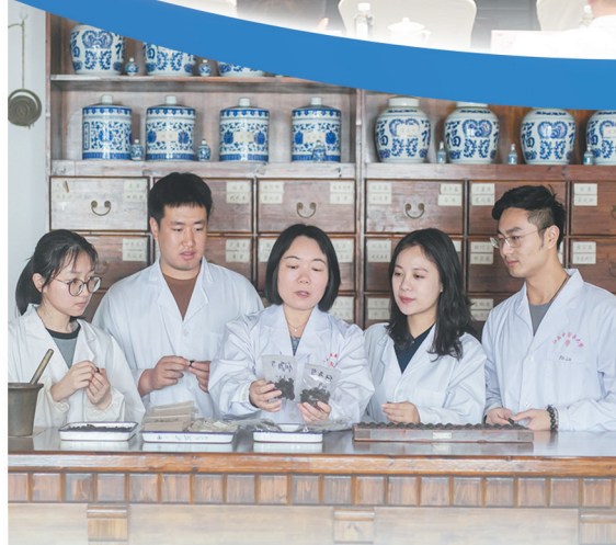
开展中医药健康促进特色行动