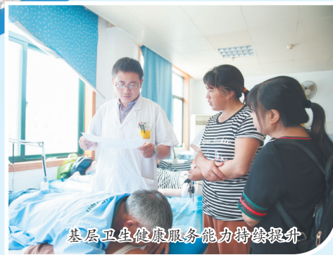
基层卫生健康服务能力持续提升