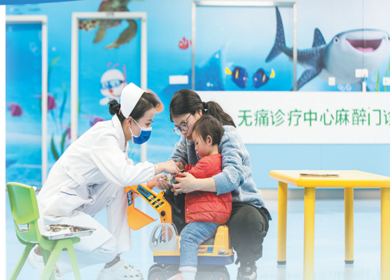
提供优质高效医疗服务