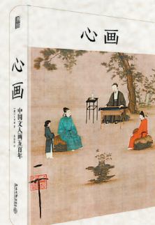
▲《心画:中国文人画五百年》 卜寿珊著 北京大学出版社