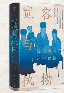
▲《宽容与执拗:迂夫司马光和北宋政治》 赵冬梅著 中信出版社