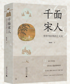
▲《千面宋人:传世书信里的士大夫》 仇春霞著 广西师范大学出版社