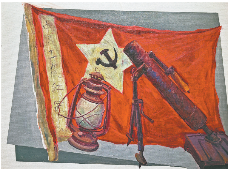
《薪火相传》钟宝滨绘