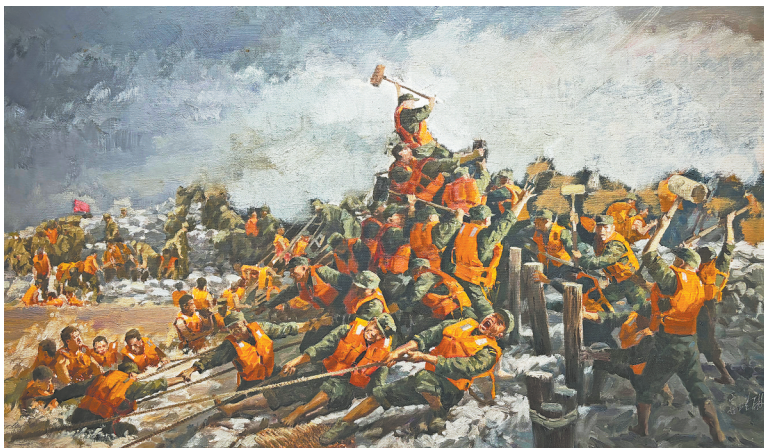
《九江大堤》安瑾林绘