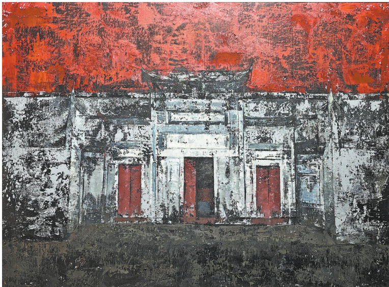
《中央苏区第一次扩大会议旧址》刘霞霞绘