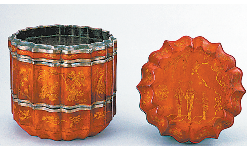
朱漆餞金莲瓣式人物花卉纹奩盖

我国古人用漆和制作漆器的历史悠久。在新石器时期的考古遗址中就已发现漆木制品。在历经战国、汉代等重要发展阶段后，宋代漆器的髹漆工艺和制作技术达到鼎盛。该奩盖内侧的朱书铭文，记录了漆器的产地、制造者姓名和品质。据文献记载，温州是宋代漆器的重要产地之一，温州漆器在当时享有盛誉。这件餞金奩既代表了宋代漆器工艺发展的最高成就，也是当时高度繁荣的温州漆器制造业的一个缩影，并改变了过去认为宋代漆器多一色、不施装饰的看法，为宋代漆工史提供了实物佐证。