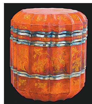
朱漆餞金莲瓣式人物花卉纹奩

朱漆餞金莲瓣式人物花卉纹奩，于1978年在江苏常州武进区一南宋墓中出土。木胎，通高21.3厘米，外径19.2厘米，内髹黑漆，外髹朱漆，为十二棱六出莲瓣圆筒造型，分盖、盘、中、底四层，浅圈足，合口处镶银扣。盖面为餞金“仕女消暑图”：二主一仆漫步，主人梳高髻，着花罗直领对襟衫，长裙曳地，一持折扇，一抱团扇，喁喁私语；侍女手捧玉壶春瓶恭立一旁；左侧放一绣墩，四周以假山、草木、花卉加以点缀，突出了春夏之交的时令气息。器壁以同样工艺饰牡丹、莲花、梅花、芙蓉等折枝花纹。出土时，盘内各层盛放有菱形铜镜、木梳、竹篾、竹别笠、小锡罐、小瓷盒等。这件漆奩后被国家文物鉴定委员会定为国宝级文物。